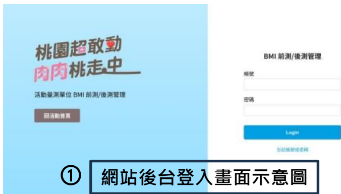
① 網站後台登入畫面示意圖